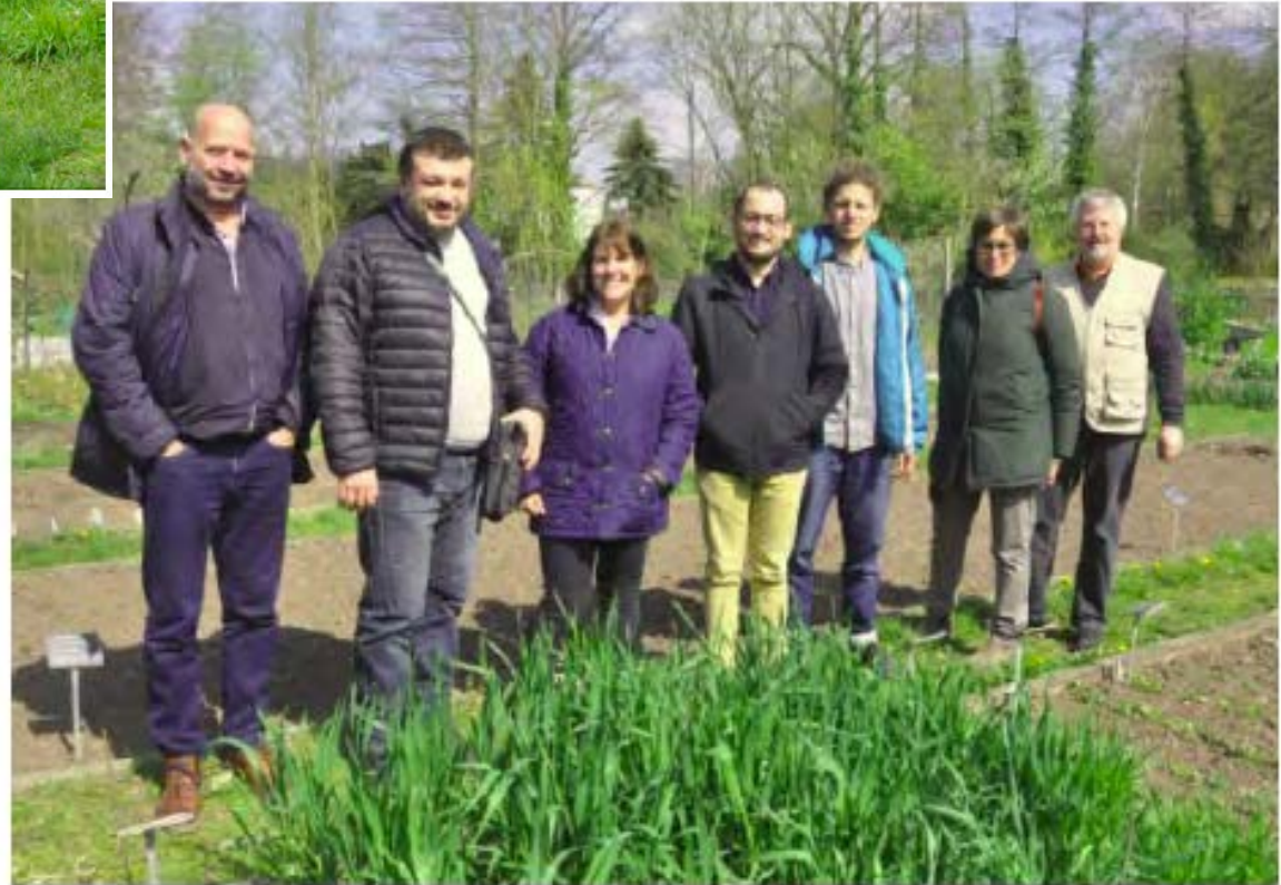
Gardeniser-Projektteam-Treffen (aus [v.l.n.r.] Griechenland, Italien, England, Frankreich und Deutschland) in Witzenhausen (April 2019; s. Bericht im DASoL-Rundbrief 37)